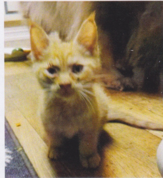
Denna lilla kille köptes på Blocket och levererades på en parkering.

Många människor vänder sig till olika säljsidor på internet, t.ex Blocket när de ska skaffa en ny familjemedlem. Det är absolut inte fel att köpa sin katt där men man ska se till att det är en seriös säljare. Tyvärr finns det väldigt många oseriösa uppfödare av olika blandraskatter och huskatter som varken har id-märkt eller vaccinerat dom när de säljs. Om man väljer att köpa ett katt via en säljsida ska man alltid få lov att komma på besök för att få träffa katten i sitt eget hem. Är det en kattunge som man ska köpa, bör kattungen vara planerad och då ska man få träffa föräldrarna till ungarna. Man ska känna att de har haft en bra start i livet med god omvårdnad och bra mat.