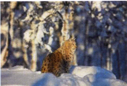
En släkting till Måns, kanske?

PS! Katterna vill gärna få lite julklappar i år också☺. Badrumsmattor som är mjuka så att de inte fryser om tassarna. Fleecefiltar och igloos är också uppskattat. Leksaker och god mat som Gourmet, både påsar och burkar, Sheba, tonfisk m.m. Även Fjällbrynt räkost i tub behövs. Det är det bästa sättet att ge mediciner på. Bara att gömma pillan så äter de upp den och man slipper bråka.